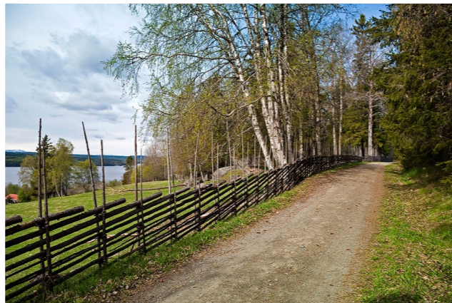
Följ vägen med gårdsgården. På höger sida står ibland den malliga kossan till höger och visar upp sig.

Kommer du från Norge eller Åre kör du E 14 fram till