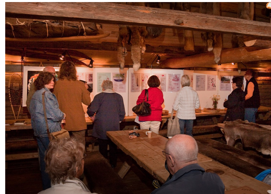
Miljön för en utställning om hållristningar är verkligen perfekt i Älghallen. Här kan man få för sig att tiden har stannat. Det varma ljuset skapar en ombonad atmosfär, lämplig för tankar.