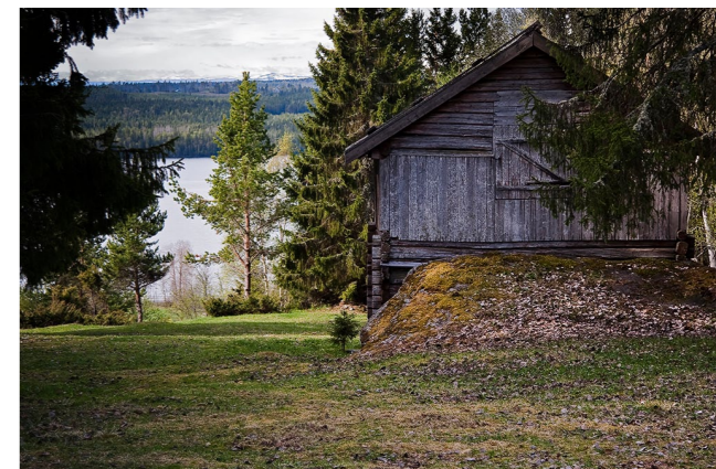
Trolsk kulturbygd ned mot Alsensjön och Ovikenfjällen.

Där nere finns en stor plattform av trä. Här står du säker och har bästa överblicken av ristningarna på andra sidan Glösbäcken. En varning är på sin plats: Om du går ut på hållarna runt bäcken ska du veta att de kan vara såphala.