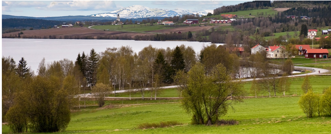
Foto taget från grusvägen upp mot Glösa. Du ser väg 666 som till höger går till Mörsil, till vänster mot Kingsta och Östersund. I fjärran ser du Åreskutan och framför den reser sig kyrkan i Alsen. Till höger om kyrkan ser du ett antal större bostadshus och stall. Det är Wången. Alsensjön är ungefär en mil lång och har ett tiotal små öar. Fisket är bra. Här finns öring, gädda, sik och abborre. Fiskekort finns att köpa.