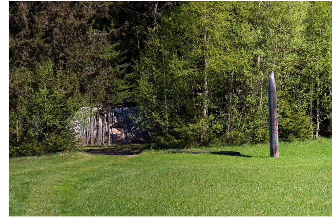
Ungefär 200 meter från parkeringen ser du vinterhyddan i skogsbrynet. Gå stigen dit upp medan du läser Glösas historia på landets kanske längsta skylt.

Det är vackert i Glösa. Och det är vackert i Glösas omgivning. Väg 666 mellan Kingsta och Mörsil är betecknad som mycket sevärd utmed stora delar av Alsensjön. Många drar efter andan då de kommer från Östersund och för första gången ser landskapet öppna sig med Alsensjön i förgrunden och den åretruntnöklädda Åreskutan i fjärran. Bäst utsikt över hela härligheten har man vid två större parkeringar i Röde.