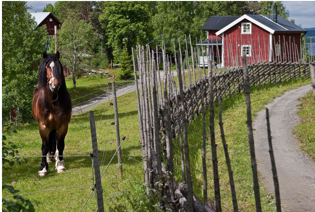
Glöstorpet. Från parkeringen går du på vägen till höger, ofta iakttagen av en äkta, nyfiken och snäll nordsvensk.